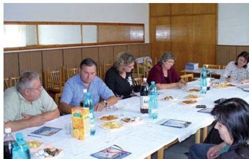
■ Pohľad na účastníkov rokovania