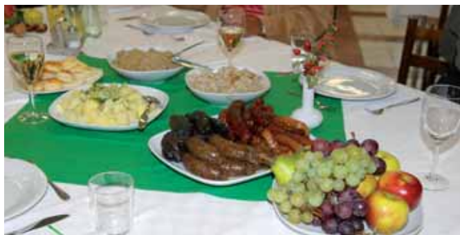
Foto z Dňa otvoreného regiónu s poznámkou v závere roka: Nech má takto pekne prestretý stôl každý živnostník! -ib-