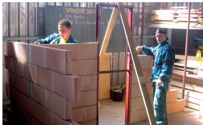
Súťažiaci v priestoroch učilišta v Kyjove

konávaní kvalifikačných skúšok na preukázanie odbornej spôsobilosti pre živnosť tesárstvo v nasledujúcom školskom roku. Bolo dohodnuté hľadať nové možnosti a obojstranne výhodné riešenia tejto spolupráce. -ig-