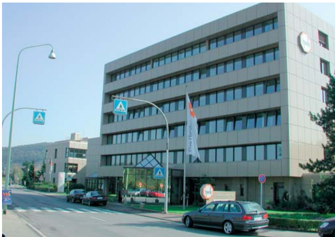
Budova Handwerkskammer v Trieri

ných podnikateľov a ďalej uční – podľa jednotlivých profesií – chodia do štátnej učňovskej školy. Tu sa vyučuje odborná teória a všeobecné predmety. Okrem toho chodia uční v priebehu jedného učňovského roku na tzv. „nadpodnikovú výučbu“ v rámci remeselných komôr. Táto „nadpodnikovú výučbu“ je