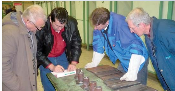
Zo súťaže Mladý zvärač , konanej 10. marca v Tlmačoch. Výsledky prinesieme v budúcom vydaní Živnostenských novín.

Priemyselné technológie zvärania vznikali až na konci 19. storočia a postupom času viedli k systému vzdelávania, ktorý odrážal potreby a nároky na tento špecifický proces. Vznikli odborné spolky a spoločnosti, ktoré popularizovali novovznikajúce technológie a nadväzujúce profesie. Prvé kurzy zvärania sa konali v roku 1933