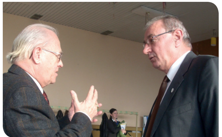
Počas prestávky na zhromaždení KZ Bratislava