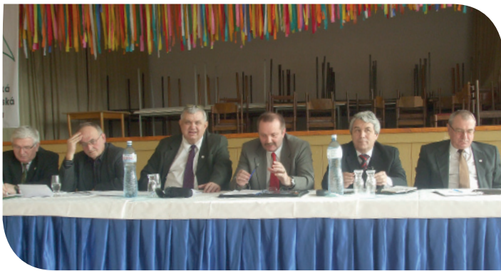
Predseda stôl na zhromaždení delegátov bratislavskej zložky na učilišti v Pezinku

■ Zmena v tiráži Živnostenských novín. Upozorňujeme prispievateľov Živnostenských novín, hlavne pravidelných z krajských zložiek, na zmenu mailovej adresy redakcie. Príspevky zasielajte na adresy ivalinka@gmail.com alebo bukvovala@t-zones.sk. Dakujeme za pochopenie. Redakcia