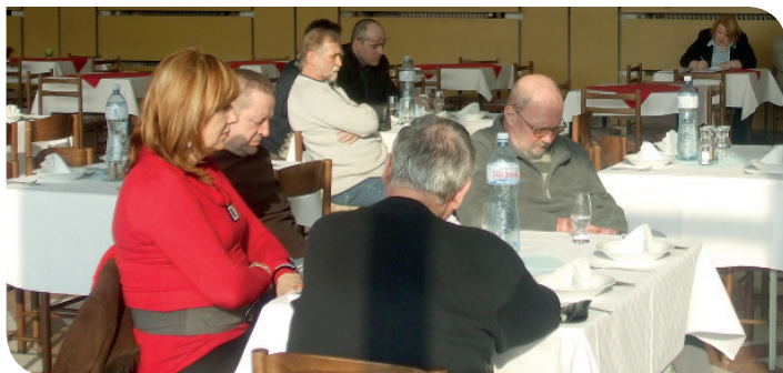
Delegáti na zhromaždení v Pezinku