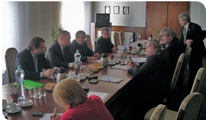
Z rokovania s predstaviteľmi Občianskej konzervatívnej strany (m)