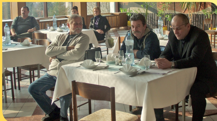
Zástupcovia CECHU TAXI na zhromaždení delegátov KZ SŽK

Ďalšie informácie pre taxikárov – členov cechu, v súvislosti s poskytovaním služieb počas majstrovstiev, budú priebežne upresňované cestou firiem (dispečingov).