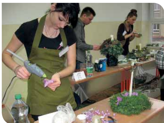
Súťažiaci pri práci