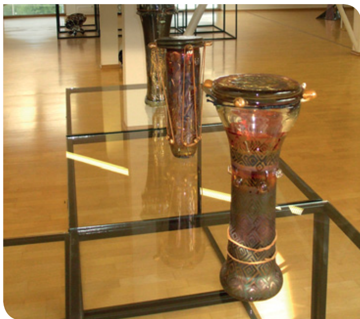
Na tému Kongo od autorky Kataríny Syrovej