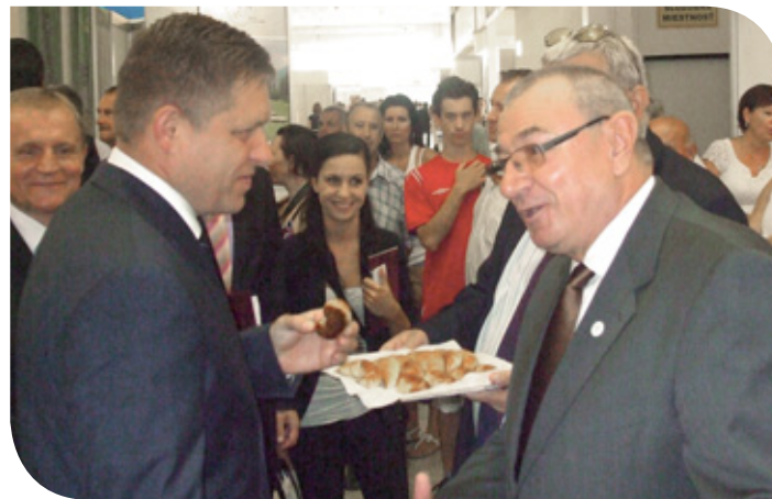
V nitrianskom stánku privítal predseda SŽK okrem iných hostí aj predsedu vlády Roberta Fica

Zamestnávateľia združení v Rade vlády pre odborné vzdelávanie a prípravu • Transformácia odborného vzdelávania má zelenú!