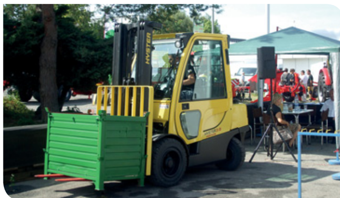
V Nitre sa konali aj 1. kvalifikačné preteky tretích Majstrovstiev Slovenska v zručnosti vedenia vysokozdvížných motorových vozíkov