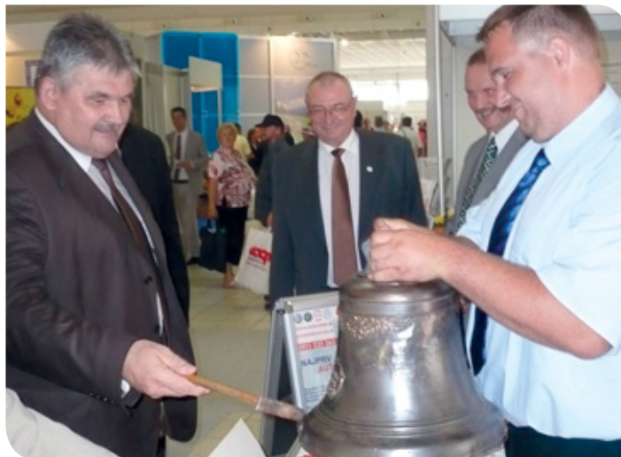
Cech zväračských odborníkov zrealizoval unikátnu opravu historického zvonu. Opravený zvon bol vystavený v stánku SZK. Poklep urobil minister práce Ján Richter