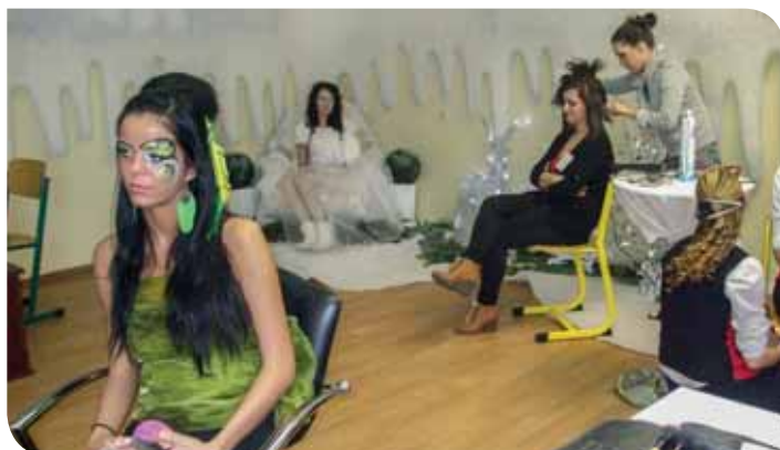
Kozmetický salón počas Dňa otvorených dverí

Pred týždňom sa konala na výstavisku v Nitre prezentácia stredných odborných škôl (prinášame riport na inom mieste dnešného vydania ŽN), kde sme v stánku SOŠ obchodu a služieb našli žiačky pri úprave účesu a chlapcov, ktorí už vedia vyrobiť pekný nábytok. (ib)