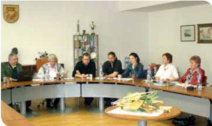
Zo zhromaždenia delegátov KZK Nitra