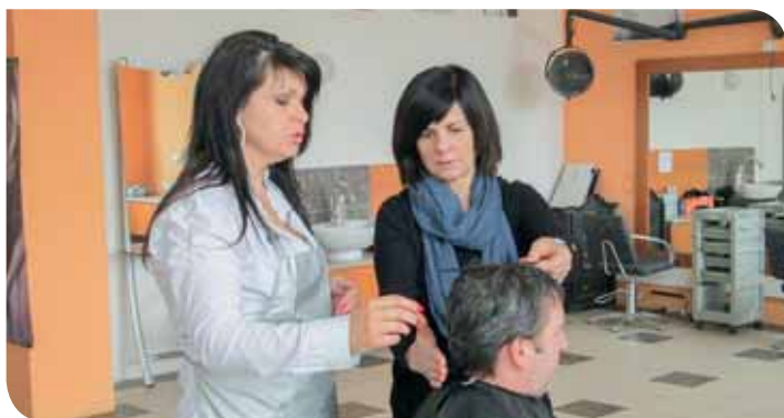
Priebeh kvalifikačnej skúšky v odbore kaderník