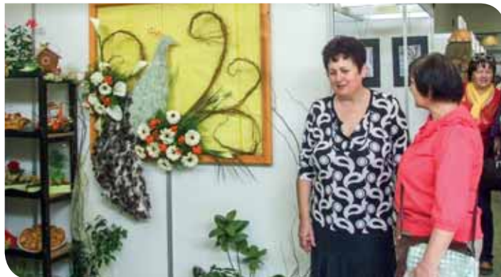
Stánok Strednej odbornej školy, Kravany nad Dunajom, na ktorej sa žiaci pripravujú na prácu záhradníka, viazača – aranžéra kvetí a pracovníka pre záhradnú tvorbu a zeleň. Dvojročné študijné odbory sú pre záujemcov o podnikanie v remeslách a službách a 4-ročné pre prácu v oblasti záhradníctva.

Škola má 62-ročnú tradíciu, sídli v budove renesančného kaštieľa zo 16. storočia s príslušnými novými budovami a rozľahlým areálom s historickým parkom. Pripravuje odborníkov pre prax v oblasti poľnohospodárstva, potravinárstva, rozvoja vidieka, krajinárstva, ochrany a tvorby životného prostredia a ďalších.