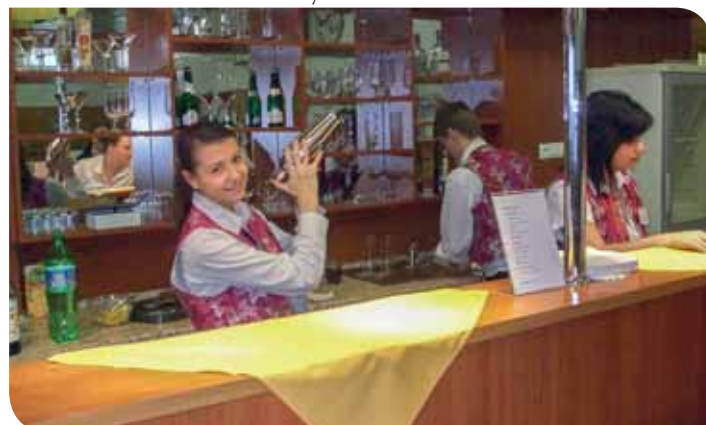
Barmanka na Dni otvorených dverí