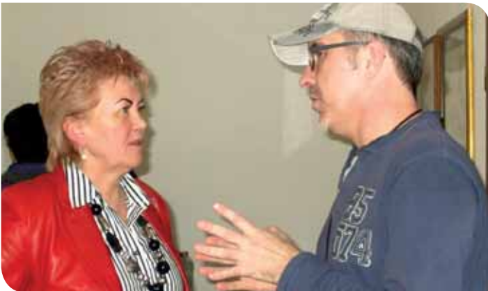
Novozvolená predsedníčka v diskusii s jedným z členov KZK