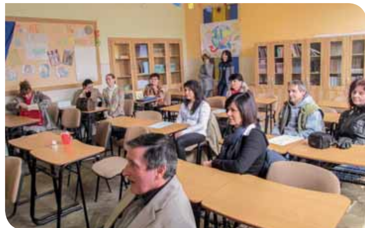
Celkový pohľad na účastníkov kvalifikačných skúšok v Trenčíne