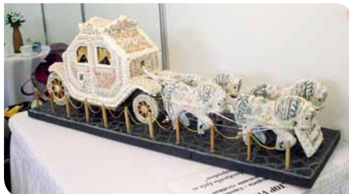
TOP VÝROBOK v kategórii Umelecké spracovanie výrobkov pod názvom Replika barokového koča so štvorzáprahom (Stredná odborná škola, Šaľa) (Text a foto -ib-)