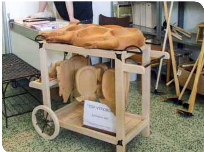
Zaujímavý výrobok Farmárov sen – kreatívna práca žiakov Strednej odbornej školy drevárskej vo Vranove nad Topľou

V rámci výstavy sa konal 17. ročník súťažnej prehliadky stavebných remesiel SUSO 2013 .