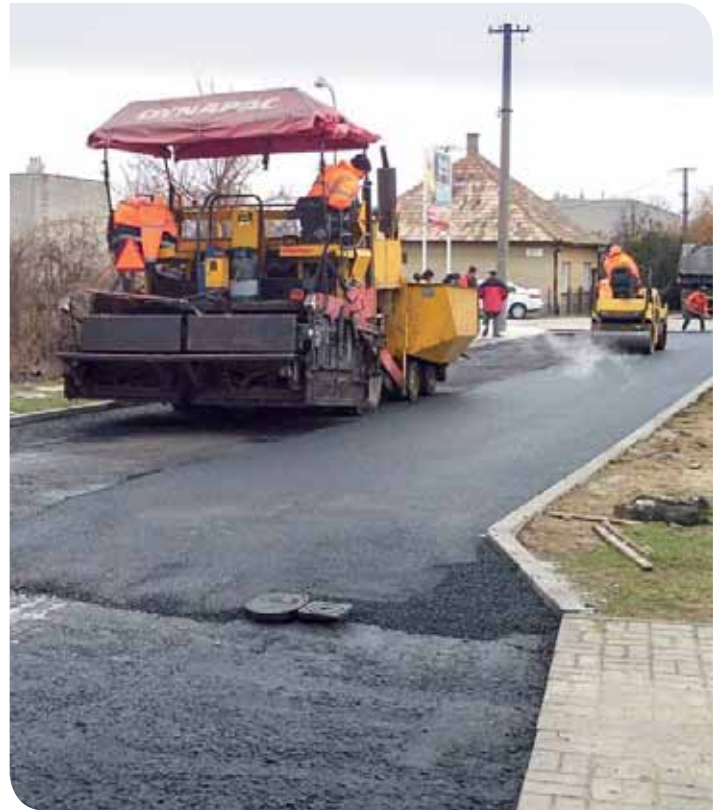
(Ilustračné foto. Zdroj internet)

Rezort dopravy nesúhlasí a vraví, že je potrebné financii pridať. „Podľa nášho názoru nie je riešením zlého stavu ciest presú-