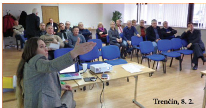
Trenčín, 8. 2.