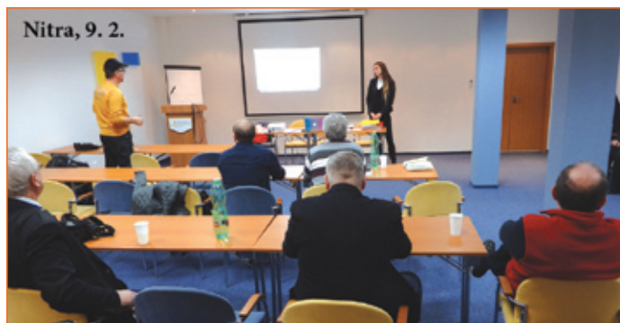
Nitra, 9. 2.