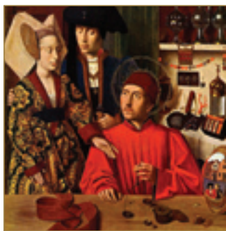
Svätý Eligius (588-660) patrón zlatníkov, kováčov, numizmatikov a kovspracujúcich remesiel

Úlohou súťaže je zvyšovať kvalitu a invenciu študentov a vo vzájomnej konfrontácii škôl zlep-