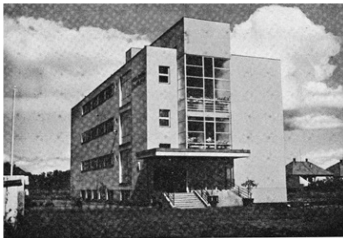
Verejná obchodná škola v Trnave v roku 1937

Rozpadom rakúsko-uhorskej monarchie v roku 1918 začalo etablovanie slovenského obchodného školstva, lebo na všetkých obchodných školách na území vtedajšieho Slovenska a Podkarpatskej Rusi sa vyučovalo iba maďarsky. Boli to trojtriedne tzv. vyššie obchodné školy so záverečnou skúškou, a to v Bratislave, Dolnom Kubíne, Turč. Sv. Martine, Ban. Bystrici, Kežmarku, Revúcej, Košiciach, Humennom, Mukačeve a Užhorode. Školy v Revúcej a Humennom boli pre nedostatok žiactva zrušené, nové školy boli zriadené v Nitre a v Skalici. V roku 1924 bol zrušený starý jednotný typ trojtriednych škôl a slovenské obchodné školy boli prispôbené osvedčenému typu škôl v Čechách a na Morave. V Bratislave, Nitre, Trenčíne, v Martine, Banskej Bystrici, Košiciach a Mukačeve boli zriadené obchodné akadémie so 4 ročníkmi, dvojtriedne obchodné školy v tých istých mestách okrem Mukačeva, ďalej v Skalici, Dol. Kubíne, Kežmarku a v Užhorode. Neskôr bola zriadená nová štátna obchodná škola v Dobšinej a v r.1929 verejná obchodná škola v Trnave.