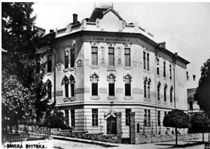
Štátna obchodná akadémia v Banskej Bystrici

Významné miesto v štruktúre stredného školstva mali odborné školy, ktoré pripravovali kvalifikovaných pracovníkov pre výrobnú sféru. Aj pri tomto type vzdelávacích inštitúcií boli evidentné podstatné rozdiely v Čechách a na Slovensku, determinované hospodárskou úrovňou oboch krajín. Rozvinutá priemyselná výroba v Čechách a na Morave mala tradíciu odborného školstva, ktoré dosahovalo vysokú kvalitu. Nízka úroveň rozvoja priemyslu a ekonomiky bývalého Uhorska, ako aj maďarizačný tlak spôsobili nerozvinutosť tohto typu vzdelávacích inštitúcií na Slovensku. Napriek podstatným zmenám v oblasti slovenského odborného školstva v medzivojnovnej Československej republike jeho kvantita, ale predovšetkým kvalita zaostávala za českými odbornými školami. Odborné školy vychovávali špecialistov, úradníkov, technikov, majstrov a kvalifikovaných remeselníkov, bez ktorých nebol možný ďalší vývoj hospodárskej výroby. Štruktúru odborných škôl na Slovensku po roku 1918 tvorili hospodárske, obchodné, priemyselné, odborné školy pre jednotlivé odvetia priemyslu, odborné školy pre ženské povolania a učňovské školy.