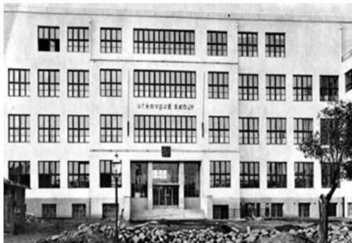
Významné bolo zriadenie učňovských škôl napr. v Bratislave