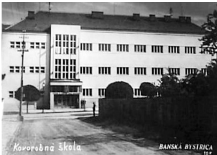
Odborná kovorobná škola v Banskej Bystrici